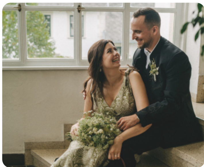
Foto: Das glückliche Brautpaar nach der Trauung