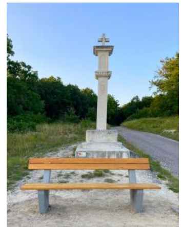
Dieser Sitzplatz konnte ebenfalls aus dem Erlös des Antonifestes neu gestaltet werden

unermüdlich für den Erhalt und die Pflege unserer öffentlichen Plätze und Einrichtungen einsetzen. Am Kreisverkehr vor dem Ort begrüßt uns seit einiger Zeit ein toll gestalteter „Blumenwagen“, das Bankerl vor dem Weißen Kreuz lädt wieder zum Verweilen ein, und die