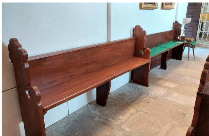
Zwei neue Bänke für die Besucher der Antonikapelle